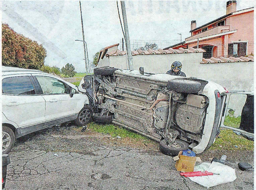
Le due auto coinvolte in un frontale a pochi passi dal Cnr di Pianabella-Montelibretti