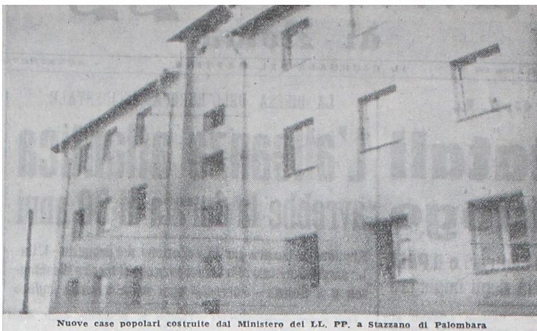
Nuove case popolari costruite dal Ministero del LL. PP. a Stazzano di Palombara

— I lavori dell'edificio sono già ultimati. — Si è provveduto inoltre alla riparazione delle strade interne di Palombara, del mattatoio, del lavatoio pubblico, dell'asilo infantile e della sede della Croce Rossa per una spesa di 6 milioni e mezzo pro danni di guerra. Altre 3 milioni e 600.000 lire sono state stanziare per la riparazione della strada d'accesso bivio Palombarese-Cretone, della strada Portavecchia e della Casa Parrocchiale di Cretone. Presentemente, come opera di pronto intervento eseguita dal Ministero del LL. PP. a salvaguardia della pubblica incolumità, vengono portati a termine i lavori al muro di sostegno al viale Garibaldi e alla scala d'accesso al viale Garibaldi-Via Trieste con una spesa di L. 1.200.000. La nostra Amministrazione Comunale, con i mezzi del suo bilancio, ha riparato le strade urbane e vicinali, ha costruito 3 abbeveratoi e 2 fontane pubbliche.